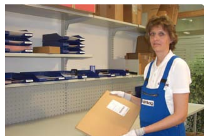
E-Mail durch Versand schafft größere Transparenz

Kunden werden bei Versand ihrer bestellten Leiterplatten auf Wunsch per E-Mail informiert. In dieser E-Mail enthalten ist