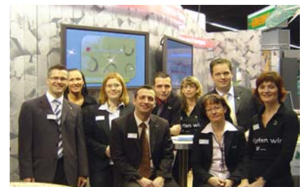
Das electronica-Messteam freut sich auf Sie!

Besucher der Messe können sich im Voraus bei CONTAG registrieren und erhalten gewünschte Eintrittskarten kostenlos zugeschickt. Wir freuen uns auf Ihren Besuch!